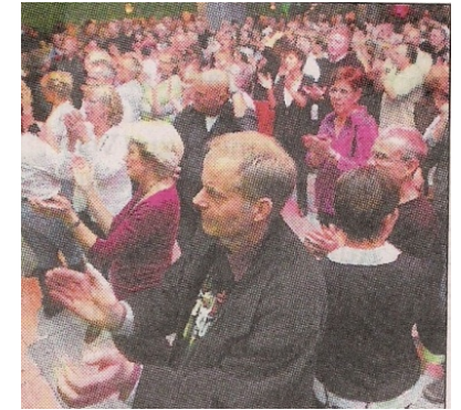
Viele kommen jedes Jahr wieder: Die Fans der Starpalast-Oldie-Nacht

Paddocks und Bad Bobs konnten sich kaum vor Zugabewünschen retten, während man den Plöner Rascals, die nach dem Hauptact aus Manchester dran waren, mehr Zuspuch gewünscht hätte. Eine Spur härter ging naturgemäß die Deep-Purple-Coverband Child in Time zur Sache. Die Kieler hatten sich zuletzt mit Auftritten rar gemacht, was daran lag, dass sie sich im Übungsraum viel Zeit für neue Stücke genommen hatten. Was